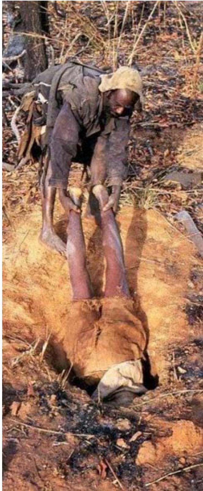
دوستانش، قبل از این که مار بازوی شکارچی را ببلعد او را بیرون می‌کشند.