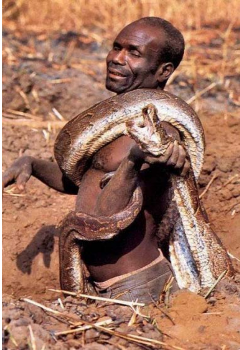
بله شكار شد ولي كار خطرناك و سختي است.